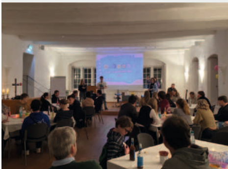
Empfang ev. Jugend